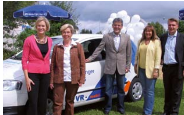
VR-Mobil Nachbarschaftshilfe Winterlingen