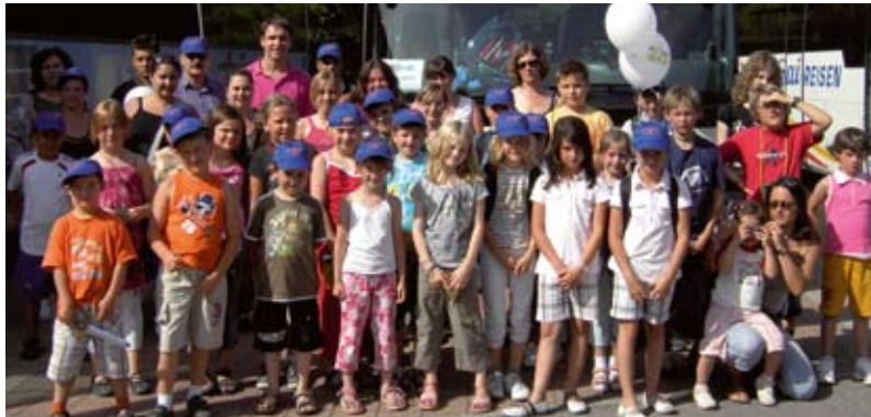
Primax-Club in Tripsdrill

Damit leisten wir einen wichtigen Beitrag für den sozialen Zusammenhalt und die Pflege des Bürgerengagements in der Region.