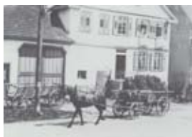
Genossenschaftsbank Winterlingen eGmuH, Ebinger Str. 56, 1941