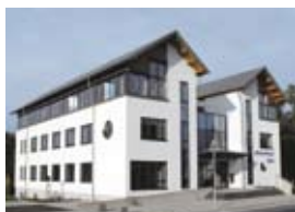
Winterlinger Bank eG Ebinger Str. 70, 2002

Wir alle, Kunden, Mitglieder und Mitarbeiter können stolz darauf sein, was sich in den letzten 125 Jahren aus der Neugründung des kleinen Darlehenskassenvereins entwickelt hat. Aus der Vision und dem Mut von damals 51 Mitgliedern ist die „regionale Bank“ entstanden. Immer auf Höhe der Zeit und auf aktuelle Marktsituationen eingestellt, ist Ihre Winterlinger Bank ein stets verlässlicher Partner.