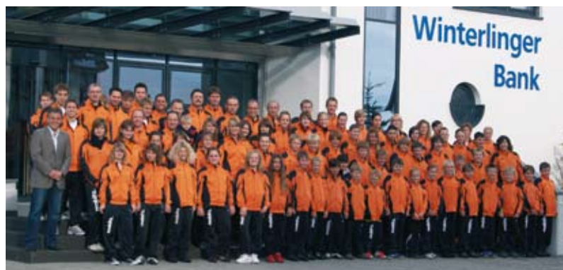
TV-Winterlingen Abt. Handball