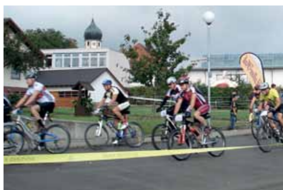
MTB-Event des Radfahrvereins „Wanderlust“