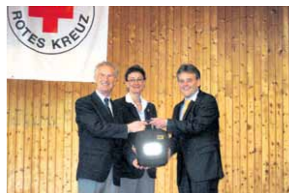
DRK OG Harthausen