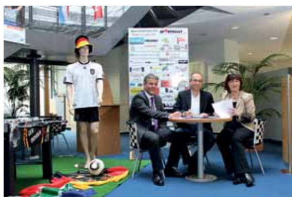
Förderverein Sporthalle Winterlingen

20 Vereine, soziale und gemeinnützige Einrichtungen in vielfältigen Projekten. Damit tragen die Winterlinger Bank und ihre Mitglieder in hohem Maße dazu bei, dass das gesellschaftliche Leben in der Region positiv beeinflusst wird.